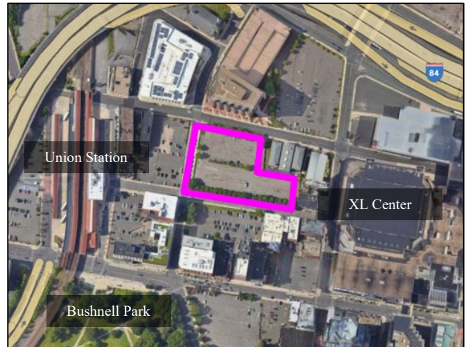
Sitio de Allyn